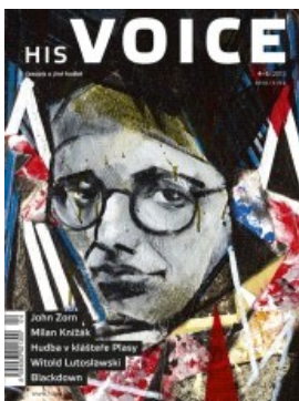
Aktuální číslo HIS VOICE 4/2013 Z OBSAHU: Filmový hudební klub Garyho Lucase