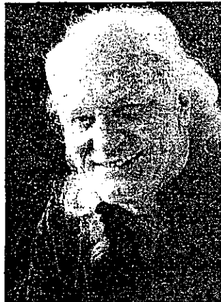
El artista Copernicus.

conferencia 'Recordando a Víctor Hugo', a cargo de Carlos Alfredo Flor Vázquez. Lugar: Cedros 107 y Víctor Emilio Estrada. Hora: 19h00. Entrada: Gratuita.